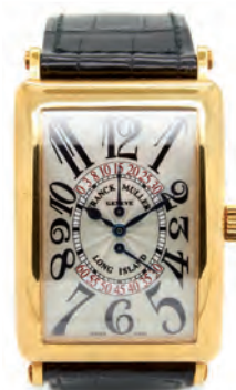
Reloj Franck Muller, Master of Complications, de pulsera para caballero. Nº 185. En oro. Correa de piel. Dial Bi-retro. Mecanismo automático. En estado de marcha. 50 x 35 mm. Adjunta certificado de autenticidad y se acompaña de su estuche original.