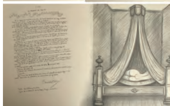
Libro "La Sima de las penúltimas inocencias" . Compuesto por 64 textos manuscritos de Camilo José Cela y dibujos de Josep M. Subirachs. Ejemplar numerado 286/999 y firmado a lápiz en la justificación de la tirada.