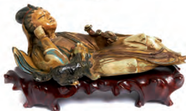
Diosa Kwan Yin. Figura en marfil tallado y policromado. China, s.XIX. Adjunta certificado CITES. 10 x 27 x 10 cm.