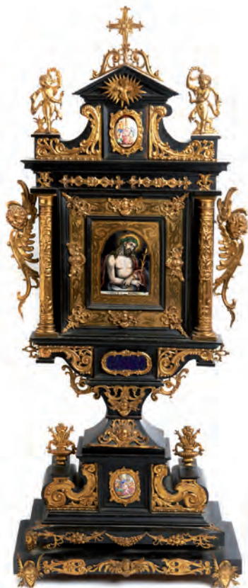
Relicario napolitano de tipo arquitectónico en madera ebonizada con apliques en bronce, s.XVII. Esmalte de Limoges en el centro representando el Ecce Homo y placas en porcelana con la Flagelación y el escarnio de Cristo. 79 x 36 cm.

JOYAS, RELOJES, MONEDAS, OBRAS DE ARTE, ANTIGÜEDADES, PINTURA, OBRA GRÁFICA, MUEBLES, PORCELANA, OBJETOS DE COLECCIÓN Y DECORACIÓN.