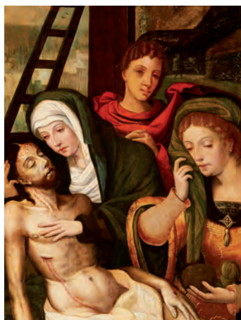
Escuela flamenca, s.XVI. Descendimiento. Óleo sobre tabla. 64,5 x 50 cm.