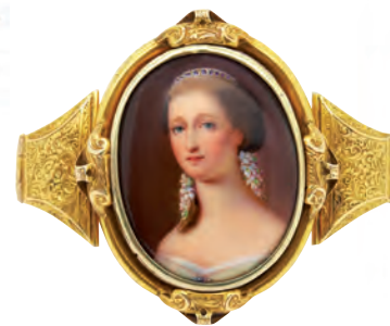
Brazalete en oro y medallón oval central en porcelana policromada con representación de Eugenia de Montijo, fles. del s.XIX. Medallón: 5,3 x 4,3 cm. Long.: 16 cm. Se acompaña de su estuche original.

LA MEJOR FORMA DE COMPRAR Y VENDER. VISÍTENOS O LLÁMENOS, LE SORPRENDEREMOS.